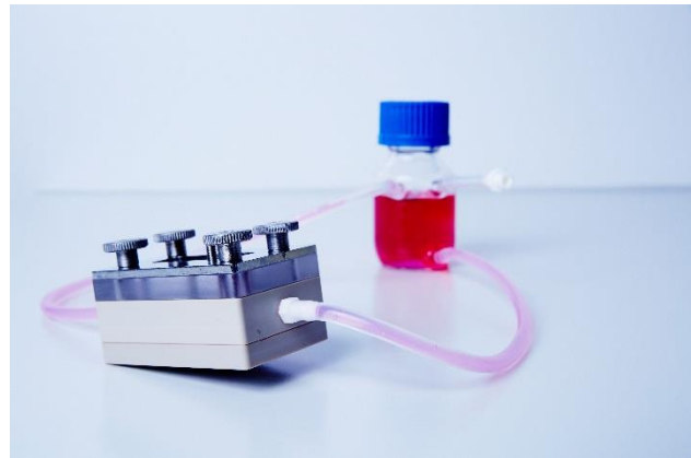
Bioreaktor für dynamische In-vitro-Kulturen.